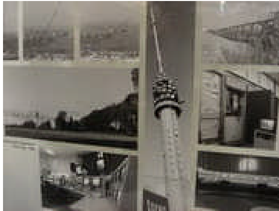
Ansichtkaart Gerbrandy toren

Op 8 mei 1962 werd de mast, met een gewicht van negentig ton, neergehaald. De redactie van 'Nieuws van de dag' meldde in de avondkrant: 'Sinds vanmorgen even over elf telt het park van radio- en televisiemasten één mast minder. Met een aanzwellende dreun, die seconden lang aanhield, smakte de meer dan tweehonderdmeter hoge mast, die van 2 oktober 1951 tot en met 16 januari 1961 televisieprogramma's het land in heeft gestraald, in het grasland.' De nieuwe mast, die al enige tijd in gebruik was, heeft een hoogte van ruim 350 meter en is, tot op de dag van vandaag, nog steeds in gebruik. De oude mast was voor andere doeleinden niet meer bruikbaar en de kwaliteit van de galvanische beschermingslaag was in de loop van de jaren zo achteruit gegaan dat het onderhoud te duur werd. De restanten van de neergehaalde mast werden trouwens opgekocht door een slopersbedrijf uit Utrecht.