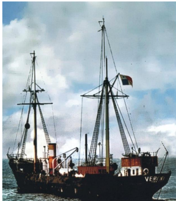
Veronicaschip 1962