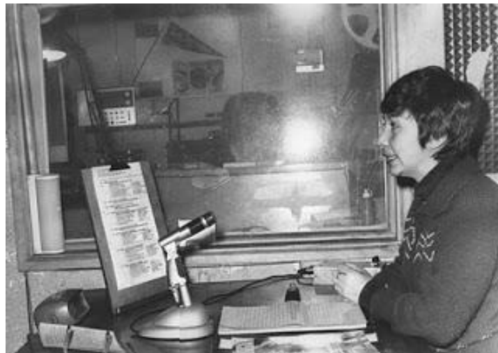
Studio La Voz de la Costa

Het bracht een vorm van onderwijs op afstand, waarbij de radio en dus de ether werd gebruikt. In Chili werd vervolgens de Radio Stichting School opgericht met als doel via de radio de bevolking op een hoger intelligentie niveau te kunnen brengen middels voornamelijk educatieve programma's. La Voz de la Costa begon op 10 augustus 1968 met haar uitzendingen. Eerst werd het programma op beperkte schaal beluisterd, want in de meeste dorpen was er geen geld om een radio aan te schaffen voor gezamenlijke beluistering.